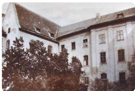
Vlevo: Východní boční a zadní trakt bývalé všeobecné nemocnice v Olomouci, Předhradí č. 7, před přestavbou pro účely Elisabethina, německé dívčí školy a ženského učitelského ústavu; foto Hermann Schleich z roku 1900