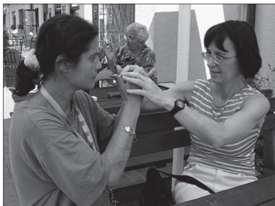
Taktilní znakování při konverzaci