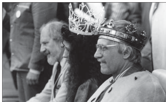
Králem Majálesu v r. 1990 se stal Ing. Václav Klaus, tehdejší federální ministr financí.