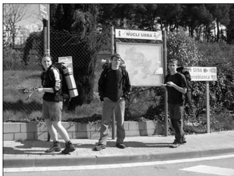
▲ Studenti Přírodovědecké fakulty UP ve Španělsku

Co se týká nabídek možností studia v zahraničí, myslím, že nabídka je široká. Student nejenže v zahraničí může studovat, ale může zkusit i pracovní stáž, říká referentka pro zahraniční styky J. Hořáková z Děkanátu Filozofické fakulty UP. Rovnou přitom vyjmenovává možnosti, které studenti UP mají. Tím nejznámějším a nejvyhledávanějším programem je Lifelong Learning Programme, tedy Erasmus. Ten se však týká země EU, navíc přes něj můžete vyjet pouze jednou za studium. Proto studenti často využívají další program a tím je tzv. Mobilita, který studenti znají také jako „Free movera“. Jedná se o rozvojový program MŠMT ČR. Program finančně podporuje studium studentů VŠ v zahraničí v rámci smluv o přímé smluvní spolupráci mezi vysokými školami, popř. formou FREE MOVERS. Zájem je každý rok velký. Například v roce 2008 bylo uspokojeno 52 studentů z 85 žadatelů. Program je určen především studentům, kteří chtějí studovat na univerzitách mimo EU. Studenti jsou do zahraničí vysíláni také na základě mezinárodních smluv. Bohužel o tomto programu Domu zahraničních služeb MŠMT ČR ví málo studentů a i když spousta informací „visí“ na našich webových stránkách, rozasílaly se na katedry letáky a u buřetu je nástěnka s informacemi o možnostech studia v zahraničí, využilo tuto možnost 21 studentů. Přitom se zde nacházejí letní školy, studijní