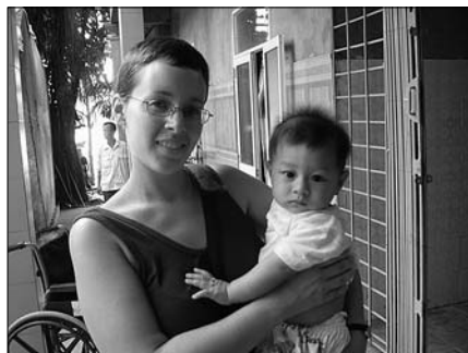
▲ Ze sirotčince v Hanoi