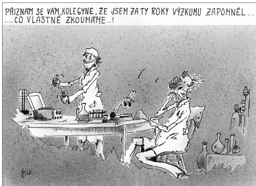
Autor: J. Mikulecký