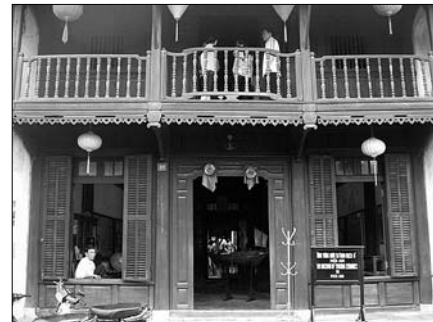
▲ Tradiční vietnamské obydlí

Přestože tato studentka oboru Mezinárodní rozvojová studia na PřF UP strávila ve Vietnamu tři měsíce, přiznává, že na to, aby Vietnam skutečně poznala, by potřebovala mnohem více času. Po třech měsících jsem pouze získala jakousi základní představu o tom, jak se ve Vietnamu žije. Lidé, které jsem zde mohla poznat, jsou velmi skromní, pracovití, spokojí se s málem. Skutečně teprve až na místě si