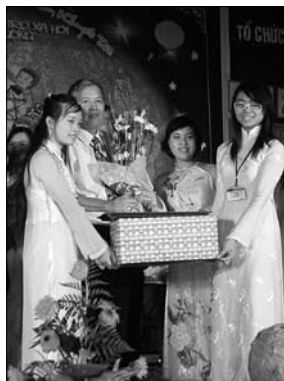
▲ Předávání darů

v této dětské nemocnici byla, její prostředí mne už tolik nepřekvapilo. Tmavé chodby, na každém pokoji několik postelí, přičemž každou sdílí jak dítě, tak i jeho rodiče, kteří jsou permanentně přítomni, aby se o své dítě starali. Po skončení programu v nemocnici jsme se nejprve přesunuli do školy pro slepé na opačný konec Hanoje, poté ještě k národnímu stadionu. Už když jsme se k tomuto místu blížili, viděli jsme na obloze tisíce svítících „balónů“. Celý prostor byl zavalen lidmi a motorkami, kterých je tu snad zhruba tolik, kolik lidí... Rozložili jsme jeden z našich bannerů a den jsme završili nočním piknikem.