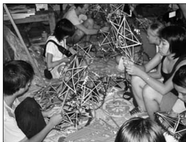
▲ Výroba luceren

Den následující nebyl o nic lehčí. Čekala nás hned dvě představení – v dětské nemocnici a ve škole pro slepé. Vše začalo opět tím, že jsme vyráběli hvězdíkové lucerny, které jsme roznášeli dětem po nemocnici. Protože jsem už jednou