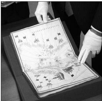
▲ Portolánové mapy (z italského portolani) jsou písemné námořní pokyny, zakreslují hlavně mořské pobřeží se všemi přístavy, zálivy a zátokami

Unikátní soubor námořních map, jejichž vznik je spojován s polovinou 16. století, byl „znovuobjeven“ v roce 2006, při příležitosti stěhování knih z archivu Vědecké knihovny Olomouc do jejich nových prostor. Hodnotu unikátní soubor námořních map, jejichž vznik je spojován s polovinou 16. století, byl „znovuobjeven“ v roce 2006, při příležitosti stěhování knih z archivu Vědecké knihovny Olomouc do jejich nových prostor. Hodnotu