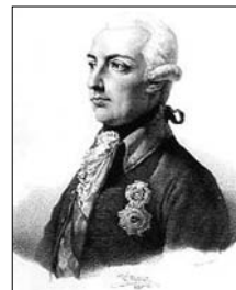
▲ Říšskoněmecký císař Josef II. (1741–1790), dobová rytina