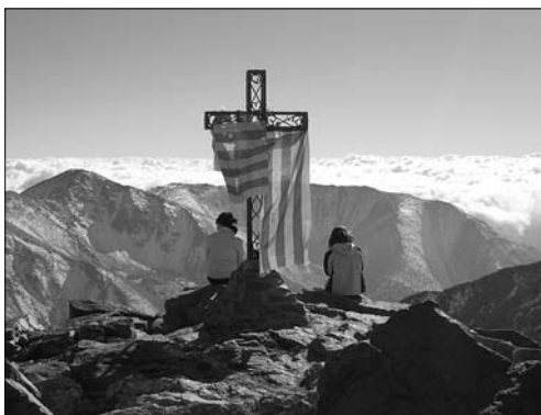
▲ Zasněžený pohled z Canigou na pyrenejské velikány

tizaci univerzit, přijímací zkoušky a zvýšení školného. Vylepovali při tom plakáty s bojovnými hesly, blokovali učebny, diskutovali, pořádali velká shromáždění a volili, jak pokračovat v nerovném boji dál. A my jsme tomu