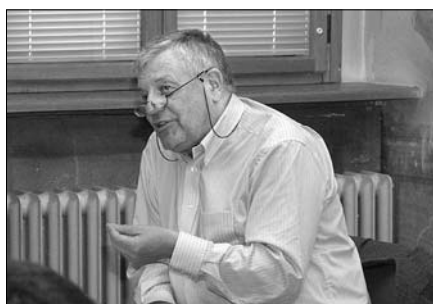
Další z cyklu přednášek „Média dnes – Aktuální otázky médií“, které pravidelně pořádá Katedra žurnalistiky FF UP, pronesl 1. 4. novinář a spisovatel K. Hvizďala na téma „Aktuální trendy v zahraničních médiích a jejich dopady v Česku“.