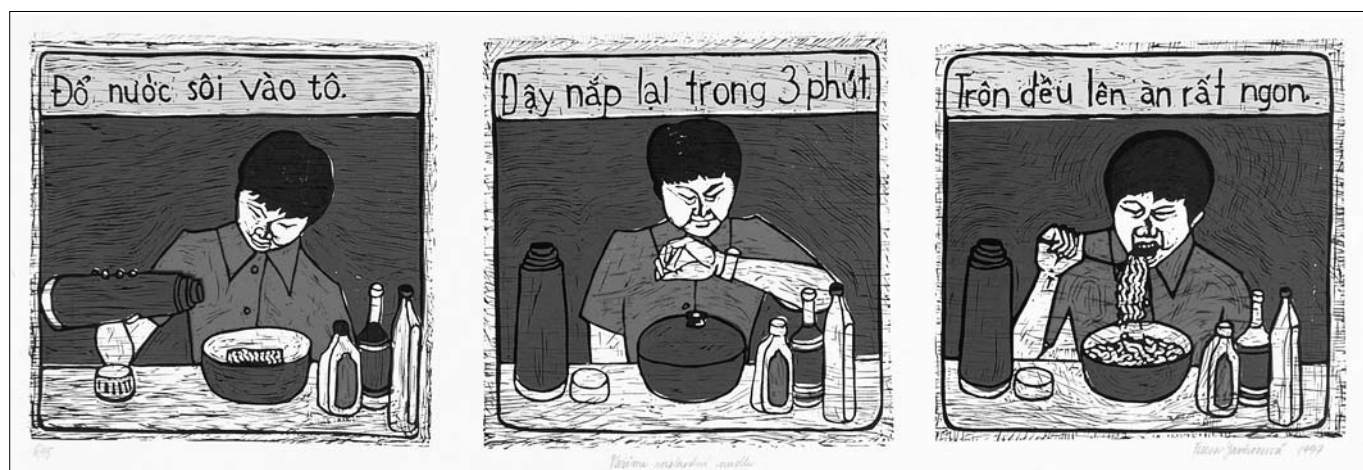
▲ T. Jankovcová: Vaříme instantní nudle, barevný linoryt, 1997