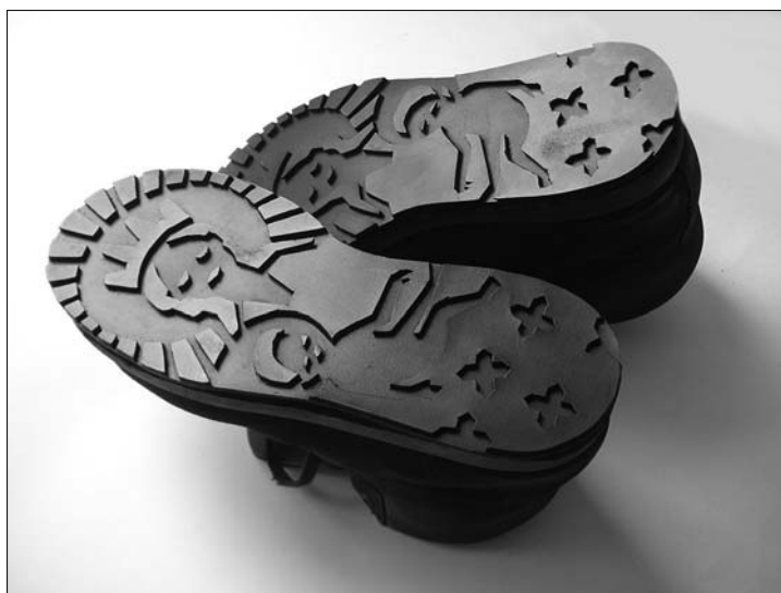
▲ L. Jirková: Svaté podrážky, digitální manipulace a tisk, 2006