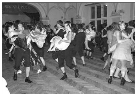
Plesová sezóna pokračovala 27. 3. tanečním rejmem v olomouckém Domě odborů, který pořádalo Vysokoškolské katolické hnutí.