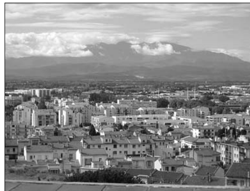
▲ Perpignan z ptáčích perspektivy

Připravila V. Mazochová, foto na předchozí straně -jv-