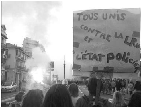
▲ Stávka v ulicích města

Lišku. Špatně jsme mu rozuměli název města nebo spíš věřili, že když ví, že jedeme do Perpignanu, jede stejným směrem. Trochu jsme se podivili, když odbočil na jiný směr, ale optimismus nás neopouštěl. Po hodině jízdy už v úplné tmě a stále v horách jsme mu nakonec v zoufalosti nabídli peníze, když nás hodí z těch prokletých hor do nějakého velkého města. A tak jel do Carcassonne. Strávili jsme s ním dvě a čtvrt hodiny, zaplatili za to 20 euro a k Perpignanu se ve výsledku nepřiblížili ani o krok. Bylo už