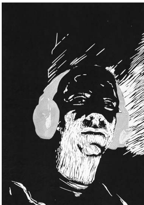
▲ J. Cenkl: Autoportrét, linoryt, 2007