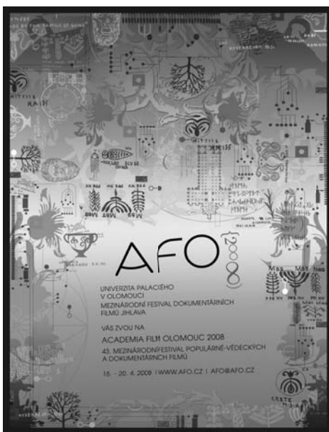
Z tiskové zprávy vybrala -map-; více na www.afo.cz .

Academia Film Olomouc byl založen v roce 1966 z iniciativy Krátkého filmu Praha, Univerzity Palackého a Československé akademie věd. Od roku 1986 byl festivalový program rozšířen o videopořady, pravidelnou součástí festivalu je sekce AFO jede do kraje, která rozšiřuje nabídku populárně-vědeckých filmů i mezi žáky základních a středních škol. Nové AFO je pak společným projektem Katedry divadelních, filmových a mediálních studií FF UP a občanského sdružení JSAF.