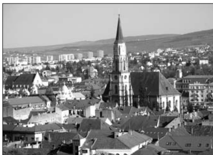
▲ Pohled na část historického centra Cluje, v popředí katedrála sv. Michaela, vzadu vlevo reformní kostel

Positivní zprávou budí alespoň to, že si tu Českou republiku nikdo již neplete s Čečenstem, či to, že se zde obecně ví, jaký je rozdíl