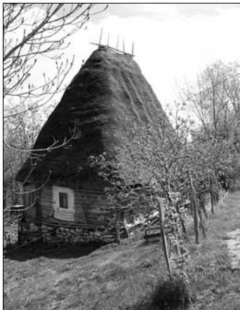
▲ Tradiční, dodnes trvale obydlený domek v horské vsi Rímeť, pohoří Trascău

Zhruba po pětadvaceti kilometrech jsem se totálně vyčerpaný dostal před bránu kláštera. Holt, když se někdo