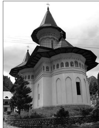
▲ Hlavní kostel v klášteře Rímeť

F. Jemelka ve spolupráci s M. Hronovou