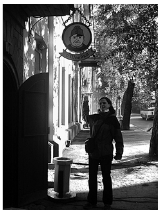
▲ Irkutská hospoda U Švejka

A jaké bylo první opravdové setkání s mongolskou kulturou? Zvláštní. Zavřeli nás ve vlaku. Zvenku nás okukovaly ženy s tigríky (mongolská měna) a na dálku se snažily dohodnout obchod. Když nám konečně vrátili cestovní pasy a my