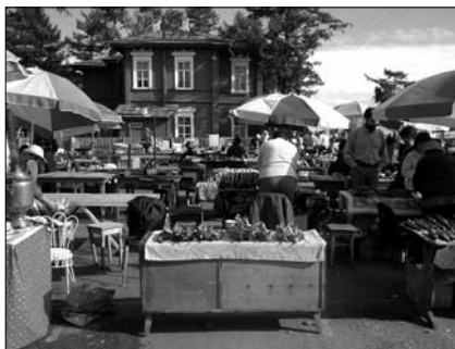
▲ Rybí trh v Listviance u Bajkalu

Z oblasti ruského dálného východu je to k mongolským hranicím už coby kamenem dohodil, ale než ukončím několikadenní pouť a „ubytuji“ se v zemi s nejrůznějšími osídleními na světě, neodpustím si ještě jedno zastavení, tentokrát u nejlubšího jezera světa. Z Irkutsku tedy směřuji k Bajkalu, přesněji řečeno, k rybářské vesničce Listvianka. Na rybím trhu poprvé v životě ochutnávám sušenou a dostatečně prosolenou rybu a připadám si jako u moře, tedy když nejsou vidět kopce na druhé straně jezera. Voda „Perly Sibiře“ je průzračně čistá. Je však velká škoda, že Rusové své nádherné přírodní bohatství ničí spoustou odpadků poulujících se u břehu. S přicházejícím soumrakem se hory na druhém břehu začínají vyjasňovat a teplota má v očích středoevropana nezvykle klesající