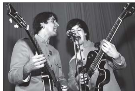
▲ Vystoupení košického Beatles revivalu The Backwards rozproudilo slavnostní zakončení festivalu

ku setkala s obrovským zájmem a hlásily se do ní celé kolektivy ze základních, středních i vysokých škol.