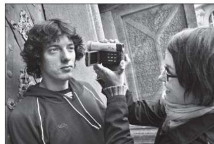
▲ Filmařskou profesi si studenti vyzkoušeli v rámci workshopu „Natoč si své video“

video, v jehož rámci mladí filmaři tvořili krátké snímky na témata závislost nebo hudba. Dílna pod vedením P. Sadílka se na letošním roční-