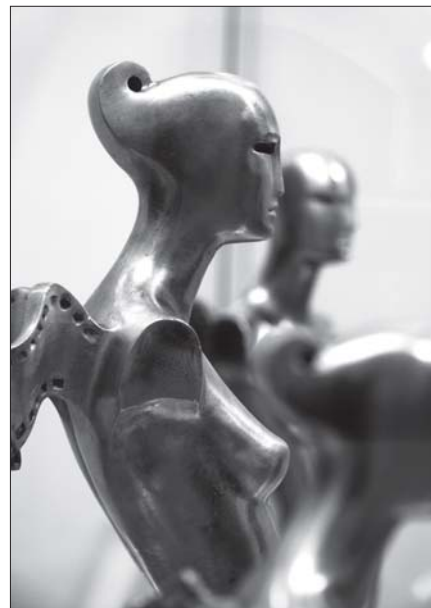
▲ Sošky pro oceněné dokumenty z dílny slévače O. Štočka

Jště než osazenstvo kina rozproudila kapela The Backwards s hity nesmrtelných brouků, porota vyhodnotila workshop Natoč si své