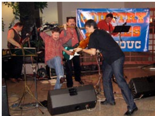
Country Expres v akci