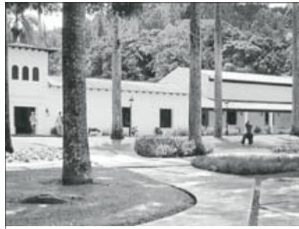
▲ Rektorát univerzity Simona Bolívara, Caracas, Venezuela

Autor těchto řádků cestoval v průběhu let 1998 až 2002 za krajany v Jižní Americe Venezuelou, Kolumbií, Ekvádorem, Peru, Bolívií, Argentinou, Paraguai a Brazílií. Dlouhodobá osobní zkušenost s pramennou základnou archivních fondů české provenience, osvětlující příčiny odchodů a průběh cest do Nového světa,