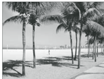
▲ Pláž Copacabana, Rio de Janeiro, Brazílie