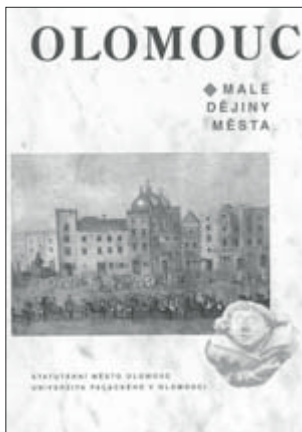
▲ Olomouc – Malé dějiny města . Vydala UP, vydání první, Olomouc 2002, 389 stran.