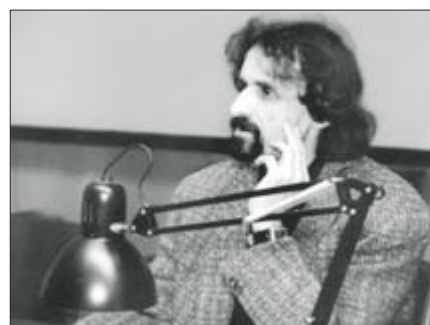
▲ Na téma „Renesanční italské bronzy“ přednášel 27. 11. ve Velkém konferenčním sále Uměleckého centra UP PhDr. J. Chlíbec z Ústavu dějin umění AV ČR. -red-