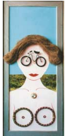
B. Smysl: Bicycle Lady, kombinovaná technika, 20x51 cm, 2000