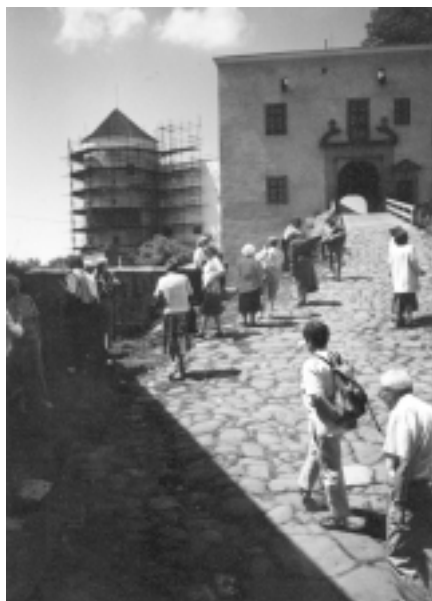
Jeden z cílů exkurze absolventů univerzity třetího věku – hrad Buchlov.

První zastavení bylo na Prateckém vrchu u Mohyly míru, památníku bitvy tří císařů 5. 12. 1805. Mohyla míru byla vybudována v letech 1909–1912 podle návrhu Josefa Fanty v secesním slohu. V současné době je prováděna oprava a restaurátorské práce vnitřního prostoru,