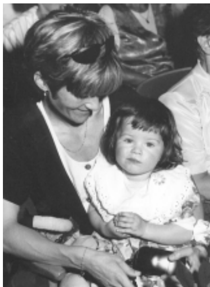
Ukončení studia na univerzitě třetího věku je i příležitostí pro setkávání generací.

Končíme dnes své studium na univerzitě třetího věku, ale s Univerzitou Palackého, která nám otevřela své posluchárny a ukázala nám, že cesta k poznání nikdy nekončí, se neloučíme.