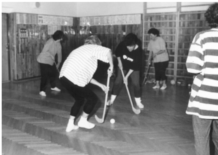
Regenerace lidského organismu pohybem může mít různé podoby.