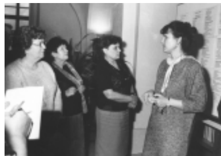
Posluchačky 1. ročníku univerzity třetího věku se seznamují s informačním systémem Ústřední knihovny UP.