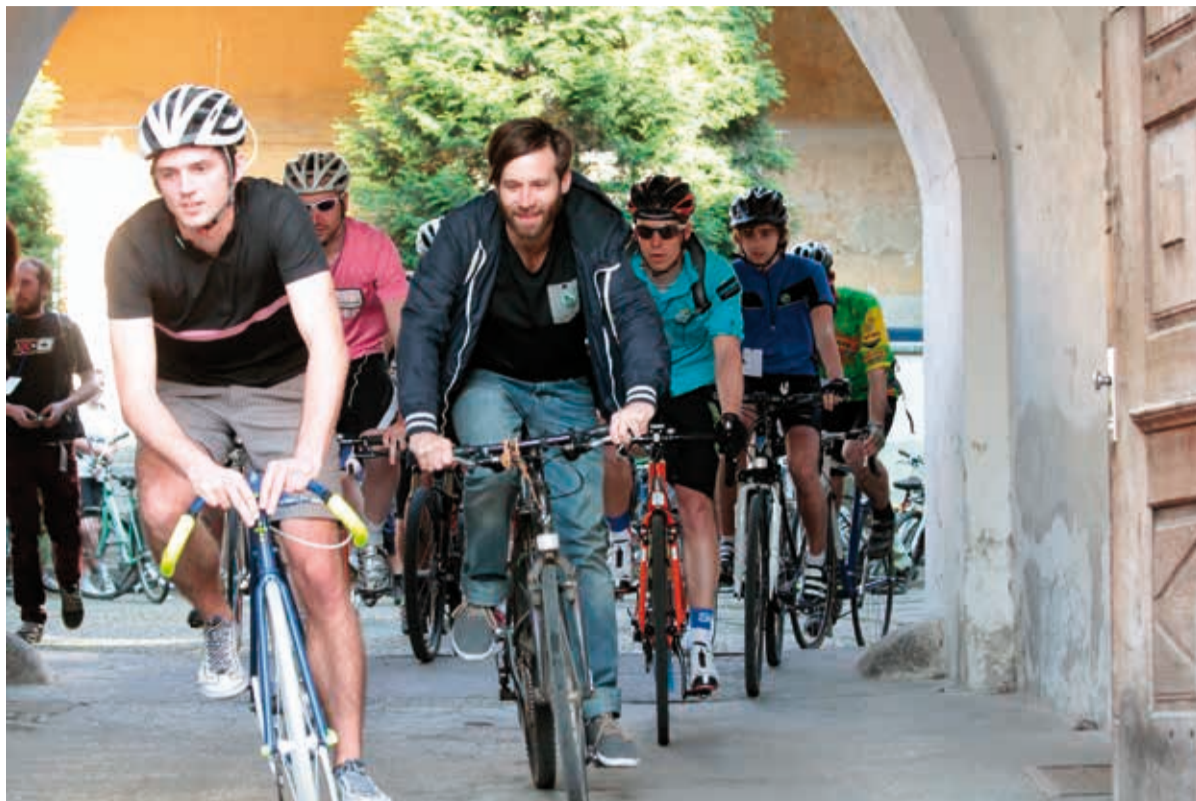
Start ve Wurmově ulici. Jako první se na trať vydali muži.