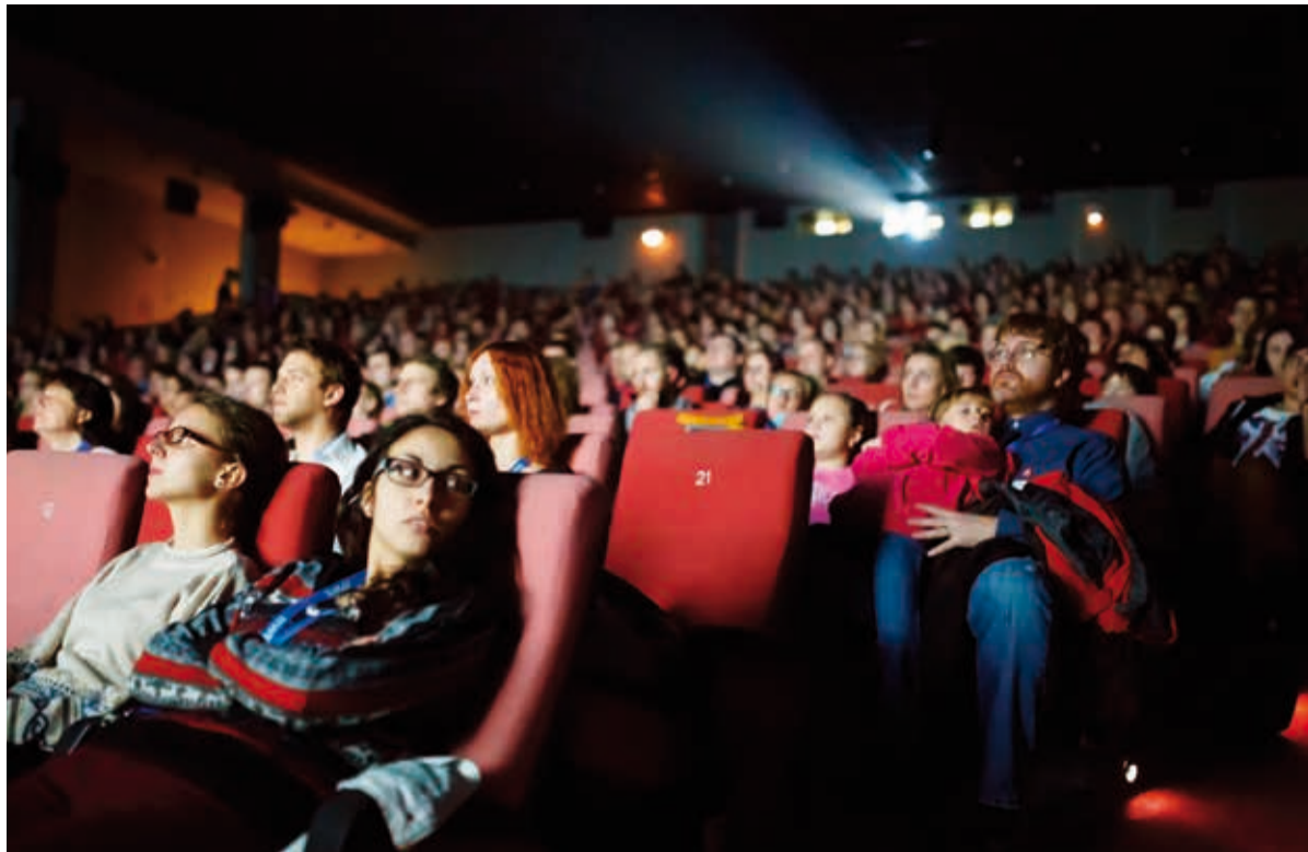
Publikum při zahajovacím ceremoniálu festivalu.

Ačkoliv hlavním cílem jeho návštěvy Olomouce bylo představení soutěžního snímku, nepodceňuje ani význam festivalového zákulisí. „Obecně lze říct, že festivaly do jisté míry ovlivňují celé filmařské dění. Shání se na nich peníze na budoucí filmy, hledají se partneři, lidé se prezentují zástupcům jiných festivalů.