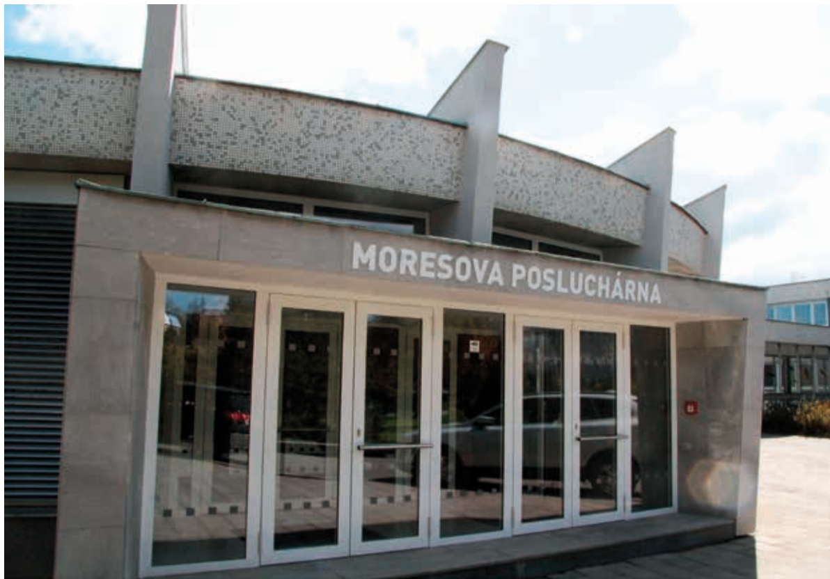
Posluchárna, do níž chodila i Moresova dcera.