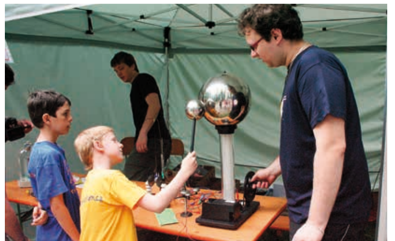
Navštěvníky jarní Flory čekají i zajímavé pokusy v podání Univerzity Palackého.

Své výrobky nabídnou i čeští, slovenští, nizozemští a polští pěstitelé květin, masožravých rostlin, kaktusů a sukulenů, okrasných keřů a skalniček. Volné plochy výstaviště budou patřit zahradnickým trhům s pestrou nabídkou zeleniny, semen, okrasných rostlin, školkařských výpěstků i zahradnických pomůcek. Vstupné činí sto korun, studenti zaplatí 80 korun. (srd)