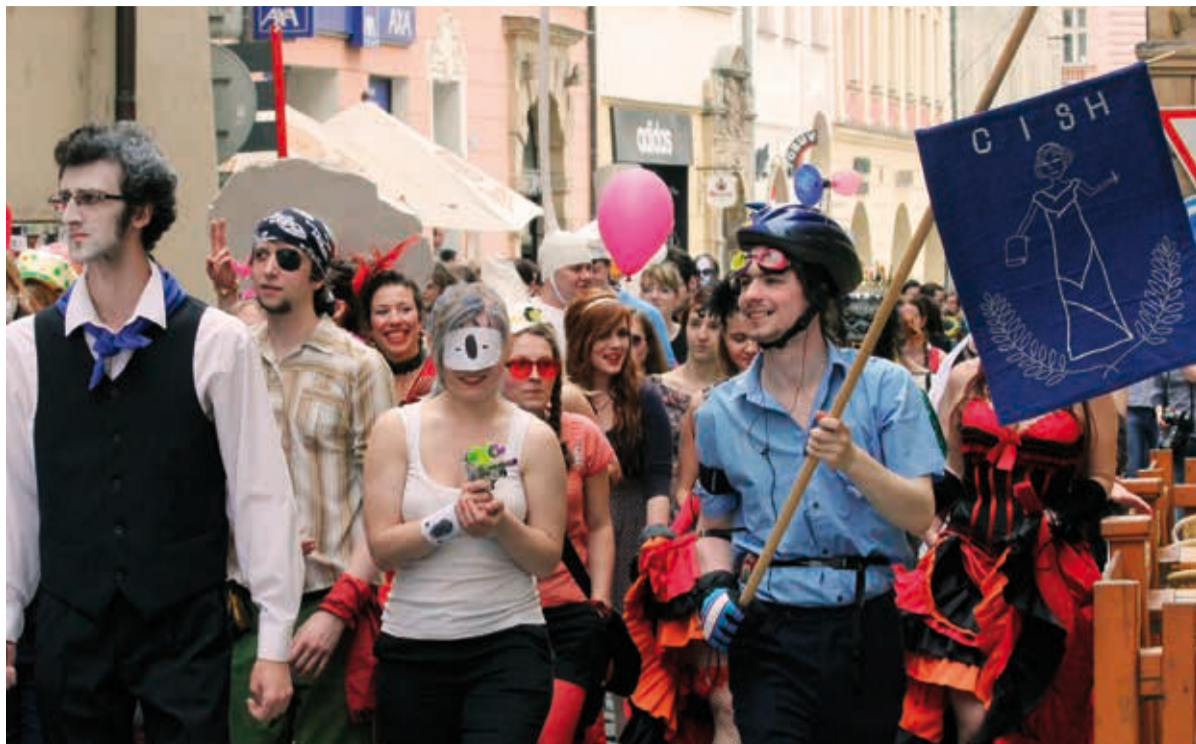
Loňský majálesový průvod mířil na Zbrojnici, ten letošní se vydá pod hradby Bezručových sadů.