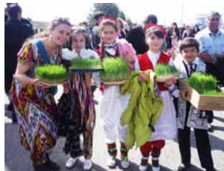
Symbol jari – naklíčená pšenica Sumanak je počas sviatkov Navrus prítomná všade

25-03-2011 „Momentálne v Dušanbe zavládla sviatočná atmosféra vďaka sviatku roka 'Navrus'. Trvaním a významnosťou je Navrus niečo ako