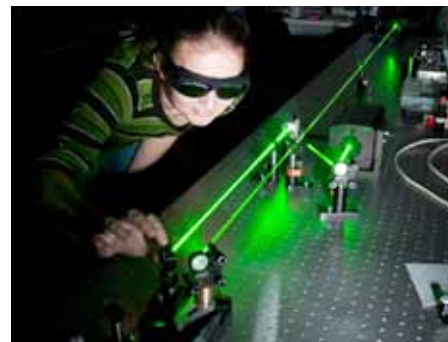
Rutinní, leč zajímavá práce v laboratoři: justování koutového odrazce

„V této oblasti dosahujeme opakovaně velmi dobrých výsledků a těšíme se i respektu zahraničních kolegů. Přesto u širší veřejnosti a mezi zájemci o studium tato skutečnost příliš známa není. Věříme, že podobná ocenění našich studentů zviditelní náš obor i skupinu kvantové informatiky a ukáží, že tu máme šikovné lidi a děláme