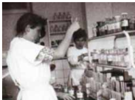
Východoněmečtí studenti absolvovali v Olomouci v letech 1961–1962 tzv. preklinické obory

Milada Hronová, foto Marek Otava, ilustrační foto archiv LF