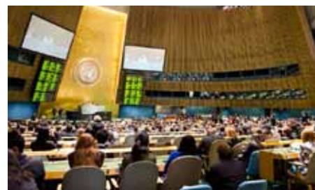
Závěrečné jednání konference v sále Valného shromáždění OSN

Na jednáních v hotelu Marriott Marquis, na křižovatce Broadwaye a sedmé avenue, olomoučtí studenti neslaví úspěch poprvé. Za čtyři roky svého zapojení v NMUN už ocenění Distinguished Delegation získali, a to v roce 2010. Od většího oceněných škol se přitom UP liší tím, že každý rok na tyto akce vysílá novou skupinu studentů. Naproti tomu řada zahraničních univerzit jde cestou vysoce specializovaných týmů, jež se podobných simulací účastní několikrát za semestr. Výsledky