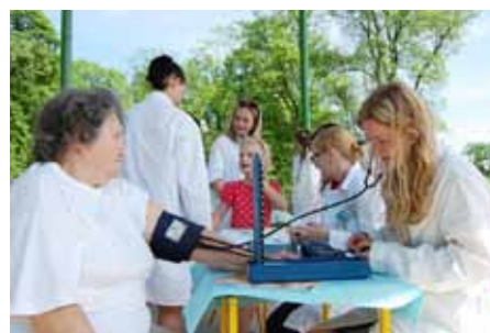
Měření krevního tlaku