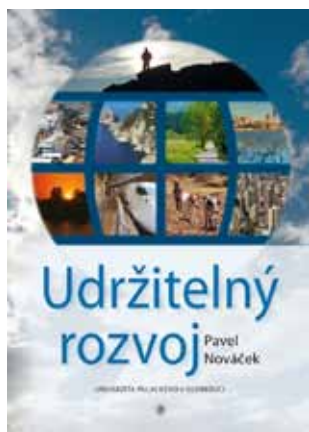
Pavel Nováček: Udržitelný rozvoj. Vydavatelství UP, 2. vydání, 2011