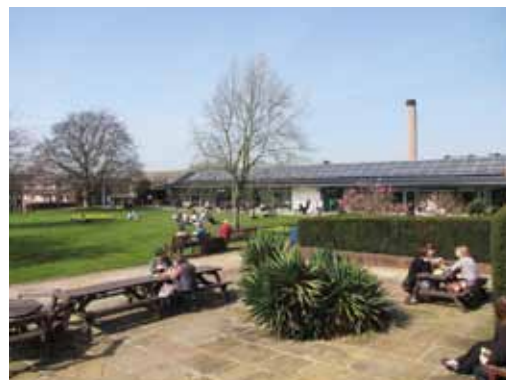
Historikové umění z celého světa o polední přestávce v kampusu Open University v Milton Keynes

Asociace historiků umění, založená v roce 1974, sdružuje profesionály zabývající se ději-