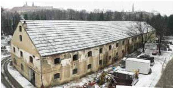
Pohled na starý dělostřelecký sklad v areálu Korunní pevnůstky

Před časem získala Univerzita Palackého v areálu Korunní pevnůstky objekt starého dělostřeleckého skladu. Za účelem vybudovat v tomto objektu Pevnost poznání ji se souhlasem statutárního města Olomouc prodalo UP za symbolickou jednu korunu občanské sdružení Muzeum Olomoucké pevnosti. Stalo se tak se společným cílem všech tří jmenovaných subjektů: zřídit v centru města vzdělávací a zábavné centrum, které by sloužilo široké veřejnosti. „Bezprostředně poté se v programu Evropské unie Věda a Výzkum pro Inovace (VaVpI) stala Univerzita Palackého – jako nový majitel objektu – žadatelem o finance pro zrealizování projektu Pevnost poznání. Nyní je vše připraveno