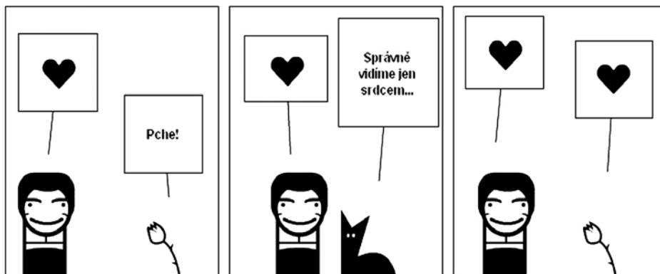
Autorka: Zuzana Kelnarová (Antoine de Saint-Exupéry: Malý princ )

(Další informace o jednání mimořádného sněmu RVŠ naleznete na adrese www.radavs.cz . Záznam z tiskové konference uskutečněné po skončení jednání mimořádného sněmu Rady VŠ je zveřejněn na adrese www.ceskatelevize.cz/ct24/domaci/137163-akademici-odmitli-skolne-studenti-ho-pry-neumi-splacet .) -mav-