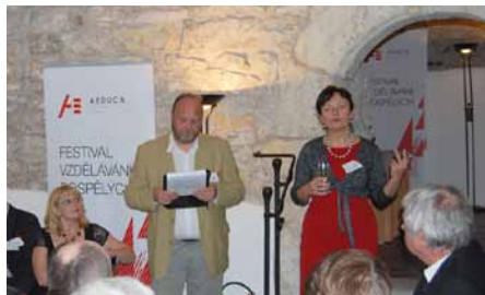
Slavnostní zahájení první části sedmého ročníku Festivalu vzdělávání dospělých AEDUCA proběhlo pod záštitou poslankyně dr. Anny Putnové (vpravo)

Pokud by se tato situace neusměrňovala, zcela jistě by k rozveření společenských nůžek došlo. Těmto nerovnostem