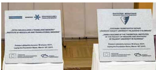
Základní kameny budoucích staveb LF UP