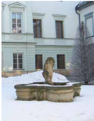
Kašna na nádvoří Rektorátu UP, Křížkovského- ho 10.

V letech 1901–1903 se objekty staré olomoucké nemocnice přestavovaly pro potřeby Elisabethina – dívčího penzionátu, vyšší dívčí školy a ženského učitelského ústavu, přičemž byl demolován průčelní trakt a nahrazen novým, dále severně posunutým průčelním traktem, kaple ve východním traktu byla zkrácena a východní trakt byl propojen s novým průčelním traktem. Na nádvoří Elisabethina byla zřízena fontána s nádrží snad ještě barokní. Na základě dobové pohlednice zobrazující nádvoří Elisabethina (obr. vpravo) lze soudit, že po obnovení olomoucké univerzity v roce 1946, dislokace rektorátu UP v prostorách dosavadního sídla proboštní olomoucké kapituly (Křížkovského 8) a Filozofické fakulty UP v objektech dosavadního Komenia (po 1. světové válce převzavšího budovy Elisabethina) byla tato fontána přemístěna na nádvoří rektorátu UP a bylo na ní instalováno sousoší dvou chlapců při koupeli, dílo sochaře Vladimíra Navrátila (1907–1975), působícího pedagogicky na univerzitní katedře výtvarné výchovy, původně součásti Filozofické fakulty, nyní Pedagogické fakulty UP. Po listopadu 1989 se při úpravách rektorátního nádvoří zjistilo, že toto značně během času zchátralé sousoší nelze k povaze jeho materiálu restaurovat, a bylo proto nahrazeno kopií figury chlapce, získanou v lapidáriu Střední průmyslové školy kamenické a sochařské v Hořicích (obr. vlevo).