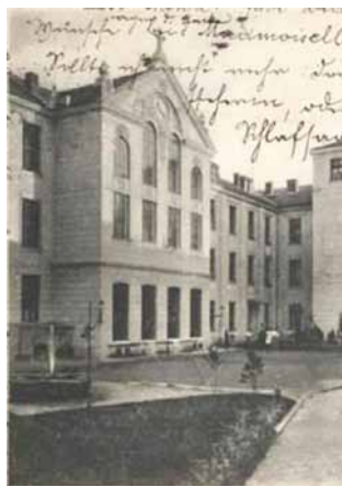
Nádvoří Elisabethina s kašnou opatřenou vodotryskem (na obr. vlevo). Výřez z po- hlednice z roku 1905