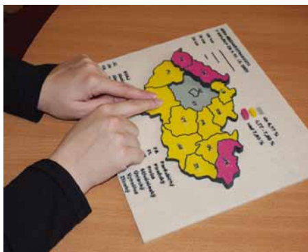
Kartogram nezaměstnanosti ve formě tyflomapy moderního typu

Moderní typ tyflomap umožňuje percepci geoprostoru velmi názorným způsobem. Příkladem jsou hmatové mapy, které vznikly v rámci vývoje na Univerzitě Palackého. Jedná se o unikátní trojrozměrné tyflomapy umožňující využití zbytkového zraku u slabozrakých osob a Braillova písma u nevidomých. Trojrozměrný tisk představuje revoluční přístup vyjádření geoprostoru hmotným způsobem. Výsledkem je trojrozměrný model, který je popsán Braillovým písmem a kontrastními barvami je odlišen pro osoby se zbytky zraku. Výsledkem práce odborníků na kartografii, geoinformatiku a speci-