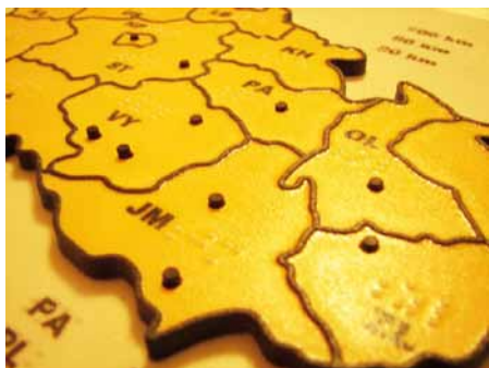
Ukázka zvukové tyflomapy památek UNESCO v ČR

ální pedagogiku je počítačový 3D model vytištěný na 3D tiskárně, která nanáší materiál na bázi sádry s pojivem v tenkých vrstvách tak, aby vznikla přesná reprezentace počítačového modelu.