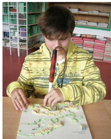
Testování prvního prototypu moderní 3D tyflomapy nadmořských výšek Evropy nevidomým uživatelem.

V České republice žije přibližně 80 tisíc osob s těžkým zrakovým postižením, z toho zhruba 10 tisíc představují osoby zcela nevidomé. Podle odhadů Světové zdravotnické organizace se navíc počet osob se zrakovým postižením neustále zvyšuje a do roku 2020 se zdvojnásobí. Jedním z nejzávažnějších důsledků zrakového postižení je nutnost naučit se orientovat ve svém prostředí s výrazně omezenými vizuálními informacemi nebo zcela bez nich, což s sebou přináší potřebu vnímat geoprostor a vytvářet si o něm představy pomocí ostatních smyslů. K vývoji těchto dovedností je k dispozici řada pomůcek a nástrojů, přičemž mezi nevhodnější patří tyflomapy. První hmatové mapy pocházejí z 80. let 20. století. Sloužily pro nácvik samostatného pohybu zrakově postižených osob. V dnešní době jsou běžně dostupné tyflomapy tvořené formou vytlačných fólií vyráběných na speciálních vakuových tiskárnách. Tyto mapy však doposud slouží spíše jako mnemotechnická pomůcka, než jako nástroj pro prezentaci geoprostoru. Moderní tyflomapy vytvořené odborníky UP umožňují díky využití 3D tisku, Braillova písma, kontrastního barvotisku a umístění zvukových nahrávek v mapě prezentaci nejen geografického prostoru, ale také značného množství tematických informací.