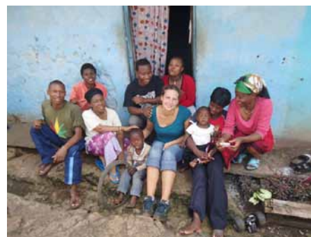
Počatná africká rodina žijící v jednom domě o dvou místnostech

Ano, ženy kreativní, které se nebojí podnikat a disponují alespoň minimálním vzděláním, jsou si díky mikrofinančním programům schopny nyní polepsit, a to nejen finančně. U těch ostatních, např. žen bez vzdělání, je potřeba větší a intenzivnější spolupráce. Co se týká mého působení a mého vlivu na samotné ženy, shledávám však posun velmi malý. I když jsme si mezi sebou vybudovaly krásné vztahy, pocítovala jsem mnohdy, že jim dávám spoustu informací, které často neumějí využít v praxi. Příkladem budiž tematika HIV, kterou jsem vždy začleňovala do svých hodin: Hodně žen, které kromě svých