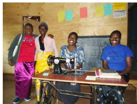
Moje ženy - švadleny