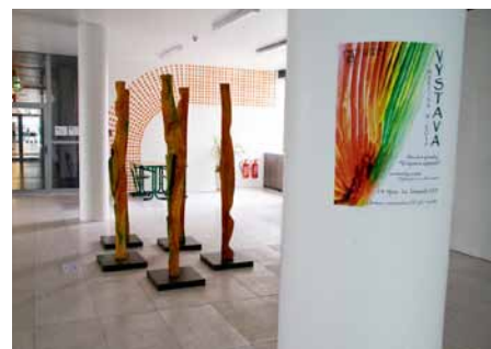
Vernisáž výstavy proběhla 13. 10. -red-, foto -mo-

K jednomu z nich patří výstava umístěná v těchto dnech ve vestibulu 4. podlaží nové budovy Přírodovědecké fakulty na tř. 17. listopadu. Pod názvem „Vzájemná sympatie“ zde vystavuje své dřevěné plastiky studentka Katedry optiky Bc. Martina Miková.