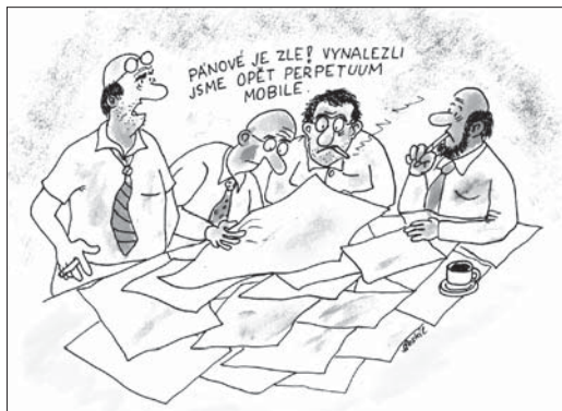
Autor: J. Dostál

To vše již několik let víme, zároveň registrujeme s jistou dávkou zklamání, že ani české Ministerstvo školství ani příslušné německé/rakouské instituce (DAAD, OeAD) nečiní nic podstatného pro „záchranu němčiny“ ve středoevropském prostoru, leč uvyklí již takové ignoranci ze strany úředníků, rozhodli jsme se pomoci si – a němčině jako jazyku české kulturní paměti – sami: Před rokem jsme do soutěže vlnivé a bohaté Volkswagenstiftung přihlásili projekt „Němčina jako jazyk humanitních věd“