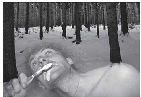
P. Bílek, foto archiv katedry

Zimní výtvarný kurz proběhl 26.–31.1. Součástí této akce bude také chystaná výstava v podkroví Uměleckého centra UP na přelomu března a dubna 2009 (bližší termín bude upřesněn).