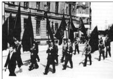
▲ 1. máj 1938 v Olomouci