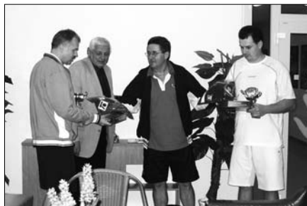
▲ Předání cen vítězných dvojic

■ Fakulta tělesné kultury UP uspořádala ve spolupráci s TK Plus Prostějov 29. 11. již 12. ročník tradičního předvánočního tenisového turnaje čtyřher UP OLOMOUC DOUBLES pro zaměstnance UP, sponzory a hosty ve sportovní hale hotelu Tennis Club v Prostějově. Turnaj proběhl pod záštitou poslance Parlamentu ČR