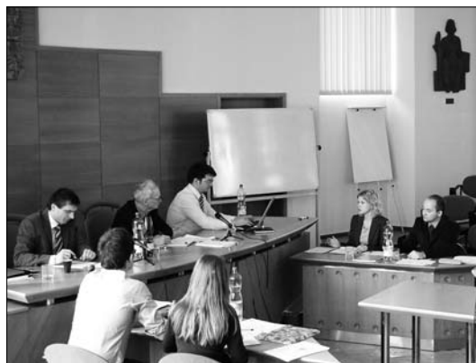
▲ Zkušební jednání aneb Pre-moot na PF UP

Největším přínosem je doplnění velmi silně teoreticky orientované výuky na právnických fakultách o praktický rozměr, který je s ohledem na povahu právnícké profese velmi důležitý. Studenti se díky tomu studiem daleko lépe připraví pro praxi, praktické formy výuky také pomáhají lepšímu pochopení teorie již v průběhu studia. Studentům praktické předměty umožňují získat představu o tom, jak probíhá