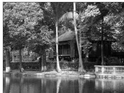
▲ Ho Chi Minhův dům

Když jsem se v kanceláři SJ Vietnam ptala ostatních, co pro Vietnamce znamená Ho Chi Minh, spustili na mne zhruba pětiminutovou opěvnou řeč o jeho záslužných činech. Mimo jiné jsem se dozvěděla, že je též nazýván Great father of Vietnam a že všichni Vietnamci jsou prý jeho děti – obětoval se pro svůj národ a nikdy se neoženil. Strýček Ho je zde považován za místního hrdinu, skvělého vůdce, jenž Vietnamce vyvedl ze dvou válek (proti Francouzům a poté proti Američanům). Děti se o něm učí odmalička, žáci se na něj jezdívají podívat za odměnu, za dobré známky. Na univerzitě mají dokonce všichni předmět Ho Chi Minhovy ideologie. A považte, v kanceláři jej mají všechny kolegyně nejen rády, dokonce jim ten předmět přijde zajímavý!