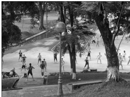
▲ Cvičící park

Každé ráno, než vypukne ranní dopravní mumraj, se Vietnamci scházejí na různých místech Hanoje za účelem provozování rozličných druhů sportů. Jestliže odpoledne patří oblast kolem Hoan Kiem jezera turistům, v časných ranních hodinách je skutečně celá vietnamská.