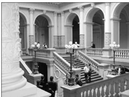
▲ Lvovská univerzita – monumentální schodiště