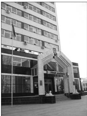
▲ Průčelí Oděské národní akademie práva

JUDr. J. Sovinský, Ph.D., Katedra ústavního práva PF UP