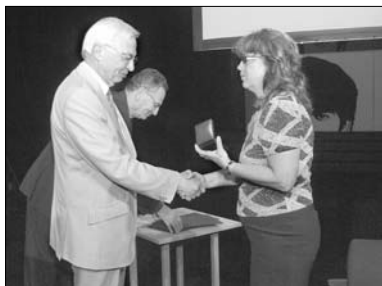
▲ Prof. J.-M. Lehn převzal z rukou prof. J. Ulrichové Medaili ČSCH