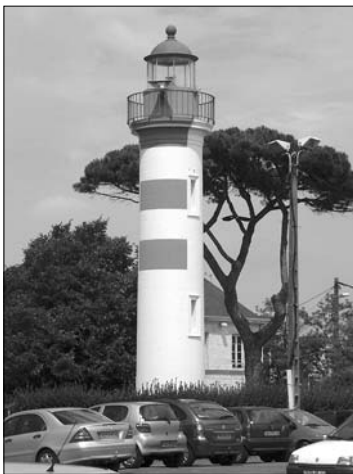
▲ Maják Phare des Baleines

Když se řekne La Rochelle, většinou z nás se vybaví Dumasovi Tři mušketýři. Je to opravdu město jako z románu. Starý kamenný přístav se strážními věžemi a majáky. Již před odjezdem do Francie jsem se o toto město začala zajímat. Věděla jsem, že je to historický přístav, ale to bylo vše. Z oficiálních internetových stránek La Rochelle jsem se ujistila, že je to krásné historické město s malebnými kamennými uličkami, rozlehlým přístavem a romantickými plážemi. O to víc jsem se na svou stáž těšila. A opravdu jsem byla po příjezdu nadšená. Brzy jsem poznala, jak jsou místní lidé sympatičtí a se vším vám rádi pomohou.