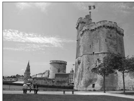
▲ Starý kamenný přístav v La Rochelle

Stáž Leonardo da Vinci pro mne byla velice přínosná – nejen z profesního hlediska. Samozřejmě, naučila jsem se spoustu nových věcí, zlepšila jsem si komunikaci ve francouzštině, ale také jsem prožila spoustu