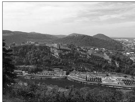
▲ Pohled na Citadelle od pevnosti Bregile

na stáži a pak i pár měsíců pracovala v novém závodě francouzské společnosti S. N. O. P., a. s., v Pohořelících u Brna. Společnost SNOP vyrábí kovové díly pro