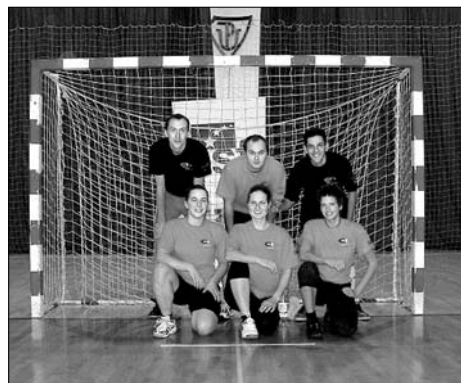
▲ APA – vítěz PS UP Cup 2008