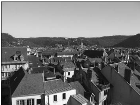
▲ Pohled na Besançon z pevnosti Griffon

Před odjezdem na stáž jsem brouzdala na internetu a strádala informace o místě svého budoucího pobytu. Do Francie jsem tak odjížděla s pocitem, že stáž bude fajn a že z turistického hlediska bude co objevovat. A nemýlila jsem se! Už během prvního týdne jsem si Besançon zamilovala a s ním celý region Franche-Comté, kde je spousta přírodních a kulturních krás. Tento kopcovitý, hojně zalesněný region leží na severovýchodě Francie a hraničí se Švýcarskem, kde se táhne pohorí Jura. Najdeme tu mnoho řek, vodopádů, kaskád nebo krasových jeskyní a také druhý největší les Francie poblíž města Dole.