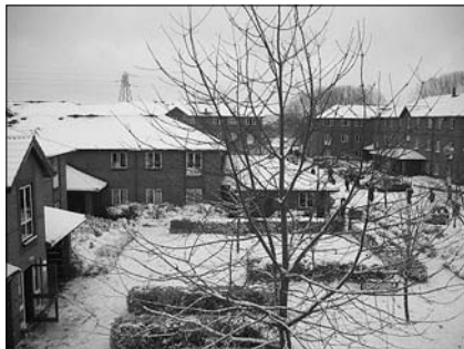
▲ Koleje v kampusu UOW

A. Ponižilová, studentka na Katedře anglického jazyka PdF UP