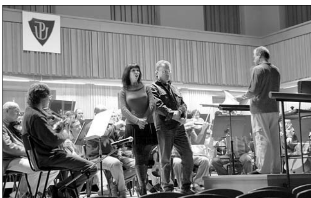
foto z generální zkoušky