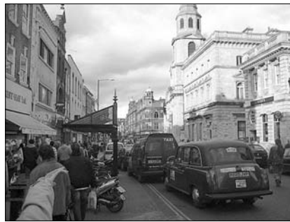
▲ Ulice ve Worcesteru

„Dear passengers, welcome on board. This flight will be leaving in a few minutes for its destination, Prague. Approximate time of arrival is 14 p.m. local time. Please follow the safety instructions and check if your seatbelts are fastened, seat backs are in upright positions, and all carry-on items are properly stowed. We wish you a comfortable flight.“