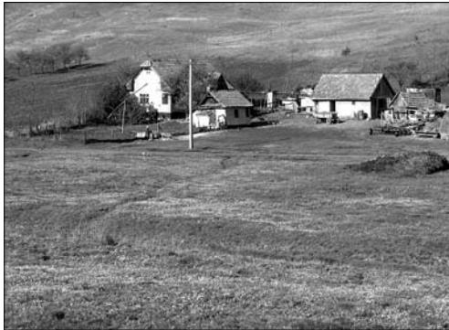
▲ Typická zemědělská usedlost severně od Alba Iulie

Protože počet dnů mého pobytu v Cluji se začíná povážlivě snižovat a je toho ještě mnoho, co bych rád sdělil, budu se snažit v posledních příspěvcích zmapovat pouze to nejdůležitější, podle mne nejzajímavější.