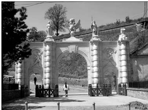
▲ Vstupní brána č.1 do pevnosti, v níž se nachází historické centrum Alba Iulie

vstupní brány, pravoslavná katedrála a klášter z roku 1921, Muzeum sjednocení a podivný pomník na paměť zemřelým vůdcům protipanského povstání z roku 1784, namířeného především proti maďarské šlechtě – to jen tak pro připomenutí vztahu Rumunů k Maďarům. U muzea můžete vidět také triumfální jezdeckou sochu oslavující Michala Chrabrého, který v 16. století na krátko sjednotil území v oblasti dnešního Rumunského státu. Honosná expozice v Sále sjednocení pak zřetelně poukazuje na to, kdo je tu dnes pánem... Pozůstatkem střetu značného maďarského vlivu s dnešní rumunskou realitou je zde zejména (již shora uvedená) gotická katedrála se sarkofágy několika významných Maďarů v čele se zmiňovaným J. Hunyadiem a nový pravoslavný chrám stojící na místě korunovačního chrámu Michala Chrabrého, jenž Maďaři ze zlosti zničili... Stejně jako v jiných transylvánských městech s „římskou minulostí“ – ta identita Rumunů značně posiluje – je i v tomto městě znatelná obliba Římanů. Na náměstí tak najdete sloup s Kapitolskou vlčicí, samozřejmě je tam také Romulus a Remus.