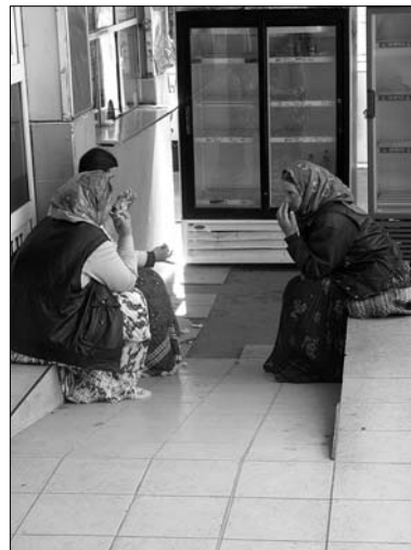
▲ Odpočívající romské pouliční prodavačky na ústředním tržišti v Cluji

činnost, která je nijak nevytvádí z rovnováhy. Tito prodejci navíc nikoho přehnaně neatakují a neokrádají, tudíž není moc proti čemu zasahovat. Druhou kastovní třídou je tzv. zlatý střed. Příslušníci této skupiny bydlí většinou v dost nevzhledných panelácích, jsou pyšní na to, že mají na Dacii (tedy spíš Renault) Logan, jezdí na výlety spojené s pověstnými rumunskými pikniky v přírodě a doufají, že i oni se budou mít díky bohatému Západu a Evropské unii dobře. Většina z nich pracuje pro stát, nebo jsou prostými zaměstnanci v pobočkách západních firem. Nemálo z nich sní o práci na Západě, aniž by si uvědomovali, že Západ právě přichází za nimi, hodlá tu investovat