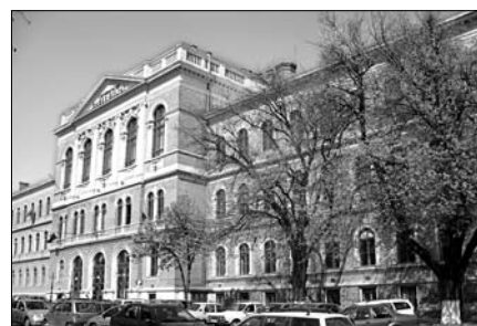
▲ Hlavní budova Babeş-Bolyaiovy univerzity, Cluj-Napoca

Samostatnou kapitolou jsou pak koleje, respektive život na nich a v jejich okolí. Že to není nic moc, jste jistě pochopili z minulého příspěvku. Svě tvrzení dnes ještě podpořím popisem kolejní kuchyňky. Je na každém patře, nechybí v ní malý sporák a dřež. Potravu zde však připravujeme jen s největším odporem. Jednoduše proto, že studenti zde vaří, vaří a va-