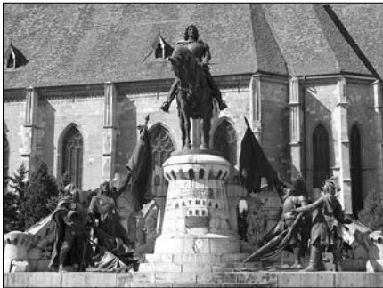
▲ Pomník Matyáše Korvína na Piața Unirii

Nemám sice moc klidu, protože ve vedlejším pokoji místních kolejí probíhá nějaká party. Studenti pouštějí regionální hitovkové disco, které lze definovat jako křížence chorvatského či moldavského pokleslého disca s kultovní cikánskou skupinou Taraf de Haidouks, ale to je život... Takže, pokračujme v tom, kterak se asi druhý nejslavnější maďarský král Matyáš Korvín v rumunské Cluji narodil a co z toho všechno vzešlo.