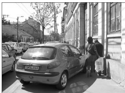
▲ Typická clujská ulice a zdejší specifický způsob parkování

F. Jemelka ve spolupráci s M. Hronovou