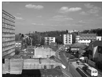
▲ Pohled na část kampusu clujské univerzity (Strada Bogdan Petriceicu Haşdeu)

Když jsem lidem před odjezdem říkal, kam jedu, ťukali si na čelo a doporučovali mi očkování proti kousnutí toulavým psem, vlkem či medvědem... Kladli mi na srdce, abych nezapomněl na dostatečně množství protipříjmových prostředků. Přiznám se, že v té době jsem