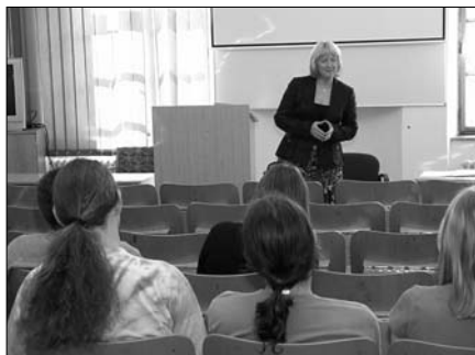
Katedra politikologie a evropských studií FF UP pořádala 17. 4. přednášku spojenou s besedou se zástupkyní ombudsmana J. Seitlovou na téma „Postavení veřejného ochránce práv (ombudsmana) v České republice“. Setkání se uskutečnilo v učebně 224 na Křížkovského 12.