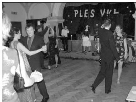
Jarní ples je každoroční organizátorskou lahůdkou Vysokoškolského katolického hnutí. Ten letošní se za „zvuku“ bohatého programu i tomboly uskutečnil 12. 4. v Domě odborových služeb.