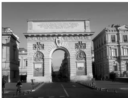
▲ Vítězný oblouk

Montpellier je turisticky atraktivní lokalitou, z nejbližších zajímavých destinací lze uvést paapešské město Avignon, van Goghem a býčími zápasy proslavené Arles, pevnost v Carcassonu, gurmány vyhledávané jeskyně Roquefort, nejvyšší most světa v Millau, modernistické letovisko La Grande Motte, křížácké město Aigues-Mortes, městečko Séte proslavené zpěvákem G. Brassensem a chovem lahodných ústřic Bouzigues či malebnou analogii provensálských Camarques, zde nikoli s bílými koni, ale s plameňáky. Asi deset kilometrů jižně se nachází středomořské pobřeží s desítkami kilometrů krásných písčitých pláží. Nemáme-li náladu se koupat, pár desítek minut jízdy autem severně začíná drsné podhůří s městečky Ganges a Cevennes či nehostinného Larzacu. Vyžití zde najdou i fanoušci fotbalu, kterým není určité neznámý stadion v Mossonu. Na své si přijdou i milovníci vín, protože Languedoc je nejmladší oblastí AOC (Appellation d'Origin Contrôlée). Já osobně jsem zatížen na doménu Pic Saint Loup nacházející se na sever od Montpellier, v počínajícím podhůří centrálního masivu. Pro milovníky kultury je zde divadlo, opera, či gotická katedrála Sv. Anny s pravidelnými koncerty.