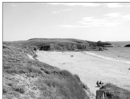
▲ Ostrov Houat

V létě se ve Vannes a jeho okolí koná velké množství hudebních a kulturních festivalů. Vstupné se obvykle pohybuje okolo 20–30 EUR. Hudebních festivalů je možné se účastnit jako dobrovolník, což znamená, že část dne pomáháte při různých organizačních pracích na festivalu (prodej ve stáncích, kontrola vstupenek,