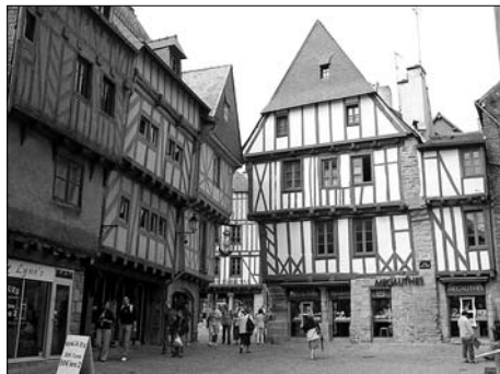
▲ Vannes – perla Morbihanu

Departement Morbihan, který se nachází v jihozápadní části bretaňského poloostrova, je považován za jednu z nejkrásnějších a nejsvráznějších oblastí Francie. Jméno tohoto departementu pochází od zdejšího zálivu a znamená „Malé moře“. Na pobřeží tohoto Malého moře, ve kterém se podle staré legendy nachází právě tolik ostrovů, kolik je dnů v roce, leží město Vannes, kde jsem v létě 2006 strávil tři měsíce na stáži v programu Leonardo da Vinci.