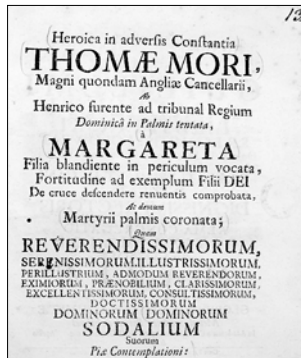
▲ Titulní list libreta melodramatu Heroica in adversis Constantia THOMÆ MORI... (Heroická vytrvalost Thomase Mora v protivenstvích), inscenovaného v Olomouci 11. a 16. dubna 1727. Vědecká knihovna v Olomouci, sign.

Obavy z dalšího budování stavovské akademie a rozšíření univerzity o světské fakulty zřejmě přiměly olomoucké jezuity ke zmírnění jejich dosavadní averze vůči doposud jedinému světskému příslušníku univerzitního pedagogic-