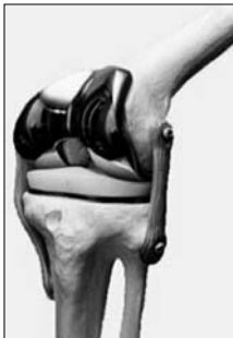
▲ Kolenní protěza

Hlavní činností společnosti Evalys je nákup a následný prodej chirurgických implantátů. Široký sortiment zboží v podstatě zahrnuje veškeré kloubní protězy, především od velkého výrobce společnosti BIOMET France, nicméně v nabídce jsou i související produkty jako různé šrouby, fixační cement atd. Klienty jsou především státní nebo soukromé nemocnice. Hlavní těžšíště aktivit se nachází v Bretani, nicméně firma má zákazníky na celém území Francie. O klientelu v Bretani se stará obchodní agent