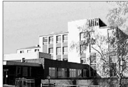
▲ Nemocnice Alphonse Guérin v Ploermelu

Náhradní kolenní kloub se skládá ze tří částí, při operaci chirurgovi pomáhá počítač při určení nejlepší polohy a nevhodnější velikosti kloubu.