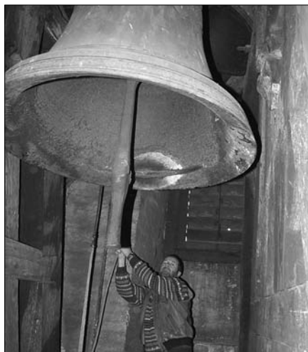
▲ Jeden ze zvonů Chrámu Panny Marie Sněžné rozhoupal 21. 2. spolupracovník Žurnálu UP T. Jemelka