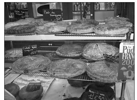
▲ „Galette des Rois“ neboli „Královské placky“ na pultech pekařství

Příjezd na začátku roku mi dal možnost poznat pár tradic doprovázejících jeho příchod. Tak především novoroční přání se zde posílají i ústně předávají v průběhu celého ledna. Stejně tak se v tomto období pobjíždá „Galette des Rois“, volně přeloženo „placka králů“, což je forma zákusku v podobě dvou placek, mezi kterými bývá tradiční mandlová náplň. Do té se dříve schovával fazolový lusk, který je v dnešní době nahrazen minifigurkou různých tvarů. Ten, kdo ji najde, se stává králem a na hlavu si nasadí papírovou korunu, kterou cukraň přikládají ke každé placece.