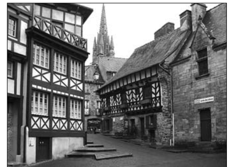
▲ Turistické centrum v Josselin, nejbližším městečku od St Servant

prázdnou, jakoby se v nich zastavil čas. Díky absenci autobusových linek mezi těmito místy je i provoz na silnici velmi klidný a nabízí možnost naplno si vychutnat krásy krajiny.