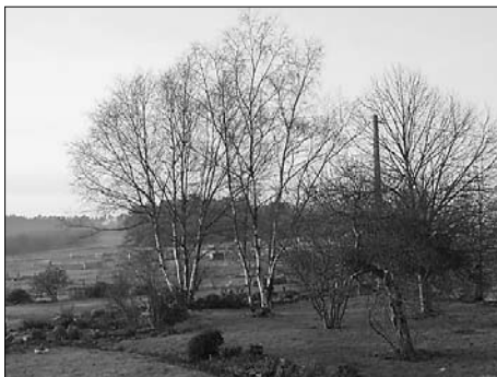
▲ Pohled z okna v okolí farmy, v pozadí přístřešky pro prasata narozená venku

Přestože je Bretaň – co se zemědělské produkce ve Francii týče – na prvním místě, modernizace, důraz na zvyšování produktivity, zahraniční konkurence i přísnější nároky na dodržování ekologických norem jsou příčinou poklesu počtu zemědělců. Díky své poloze v blízkosti moře, mírnému klimatu a mnohým přírodním, historickým i architektonickým zvláštnostem se daří turistickému ruchu, což mnohé zemědělce přimělo spojit svou zemědělskou činnost s činností turistickou.