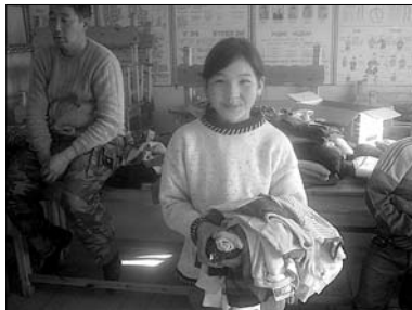
▲ Rozdávání oblečení

Je listopadové pondělní ráno. Po víkendů jdeme s Tanjou do školy a moc se těšíme na chvíle, až si zase budeme hrát s dětmi. Ale co se to zase děje? Před mými zraky se ratolesti řadí do zástupu a vypadá to, že dnes z výuky nic nebude. Ničemu nerozumím. Aha, nerozuměla jsem jen chvíli. Dnes je totiž den, kdy se jde do sprch! Ano, prostě se jde do sprch... Většina těchto dětí totiž doma sprchu ani tekoucí vodu nemá. Proto se zhruba jednou za 14 dní sprchují v rámci školní docházky ve veřej-