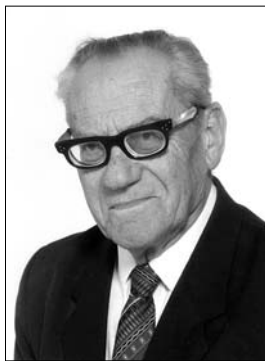
Doc. J. Bieberle, CSc.

K jeho devadesátinám jsme ho oslovili mottem „Dobrý člověk ještě žije“. Dnes k tomu se smutkem a nostalgii dodáváme „Bude trvale žít v našich vzpomínkách“.