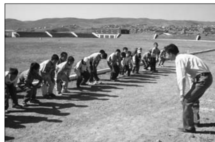
▲ Sportovní den