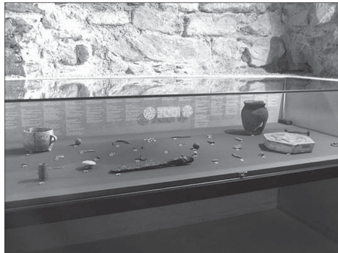
▲ Z expozice archeologických nálezů v suterénu bývalého olomouckého kapitulního děkanství – Arcidiecézního muzea Olomouc

Předložená habilitační práce je vystavena od 8. 9. 2006 v knihovně FTK UP.