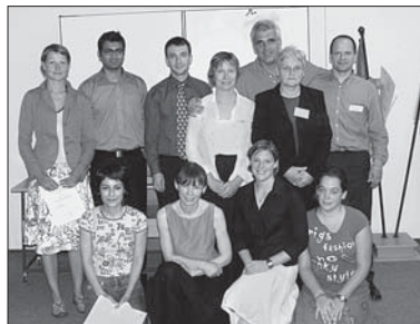
▲ Skupina, která ukončila studia Erasmus-Mundus, APA