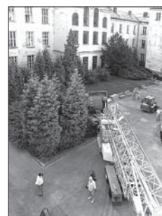
Připravila -map-, foto -tj-

Stavební práce provádí firma OHL ŽS Brno, a. s., divize Stavitelství Olomouc, s termínem dokončení 30. 6. 2007. Smlouva o dílo je uzavřena na částku 56 165 tis. Kč, z čehož je ze státního rozpočtu (dotace MŠMT) hrazeno 42 666 tis. Kč, zbytek bude hrazen z prostředků UP.