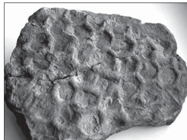
▲ Paleodictyon (Glenodictyum) praedicum , křída, lokalita Štýty

Lethaia, která byla výsledkem loňského workshopu a s přípravou mezinárodně závazného katalogu ichnofosilií v tzv. Treatis on Palaeontology .