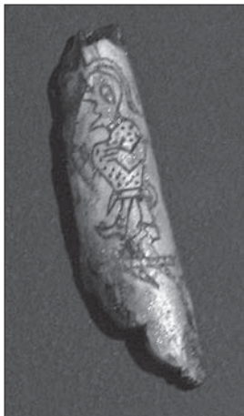
▲ Kostěná střenka perořízku s bohatou výzdobou. 2. pol. 10.–poč. 11. stol. Nález v areálu původního (před trans-lací r. 1144) biskupského dvorce na Předhradí. Olomouc – Zbroj-nice