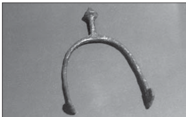
▲ Ostruha s háčky, bronz, 8. stol. Jedna z řady na Povlu nalezených a pro předvelkomoravskou dobu typických ostruh jízdních bojovníků